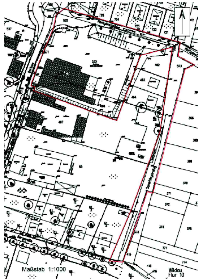
Lageplan zur Abgrenzung des Geltungsbereiches der 4. Änderung des B-Planes „Dorfaue Wildau - Hoherlehme“

Der Plan ist genordet und auf der Basis der ALK der Gemeinde Wildau abgebildet.