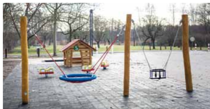
Spielplatz „Am Marktplatz“

lich dazu zwei Minischaukeln errichtet und ein neuer Fallschutz verlegt. Die Abnahme der neuen Geräte durch den TÜV erfolgte am 27.01.2021, der Bauzaun ist entfernt und der Spielplatz damit freigegeben. Wir wünschen viel Spaß beim Erkunden der neuen Spielgeräte!